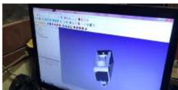
Gambar 2; Desain 3d alat