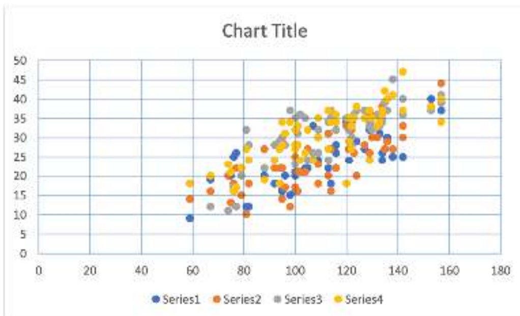
Diagram 2; Scatter plot menunjukkan distribusi data

Merujuk kepada hasil penelitian yang akan diproduksi massal dalam kegiatan ini, memiliki tujuan untuk memodernisasi instrumen tes koordinasi motorik Körperkoordinationstest für Kinder (KTK) Jumping Sideways menjadi berbasis digital. Pada penelitian ini alat tes manual yang telah ada dimodifikasi, kemudian diuji validitas dan reliabilitas tes sehingga nantinya dapat digunakan secara luas. Uji normalitas dari penelitian tersebut dengan sebaran distribusi data seperti diagram 2.