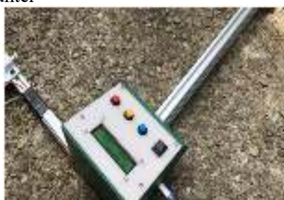
Gambar 4; Alat yang akan diproduksi massal