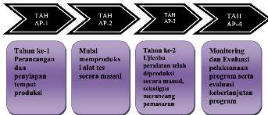
Diagram 1; Tahapan kegiatan pengabdian

Agar tercapainya target ini maka diperlukan upaya bersama mitra, melalui Kepala Sekolah dan guru Penjasorkes di tingkat sekolah dasar untuk dapat menjalankan rintisan kegiatan usaha produksi instrumen tes berbasis digital. Melalui usulan kegiatan abdimas Program Pengembangan Produk Unggulan Perguruan Tinggi Layanan Digital Pembelajaran ini diharapkan nantinya mitra dapat berperan sebagai produsen alat tes digital sekaligus memanfaatkannya sebagai instrumen untuk peserta didiknya. Rencana kegiatan pengabdian akan dilakukan secara berkesinambungan. Adapun tahapan dan langkah-langkah kegiatan disampaikan dalam roadmap kegiatan berikut ini: