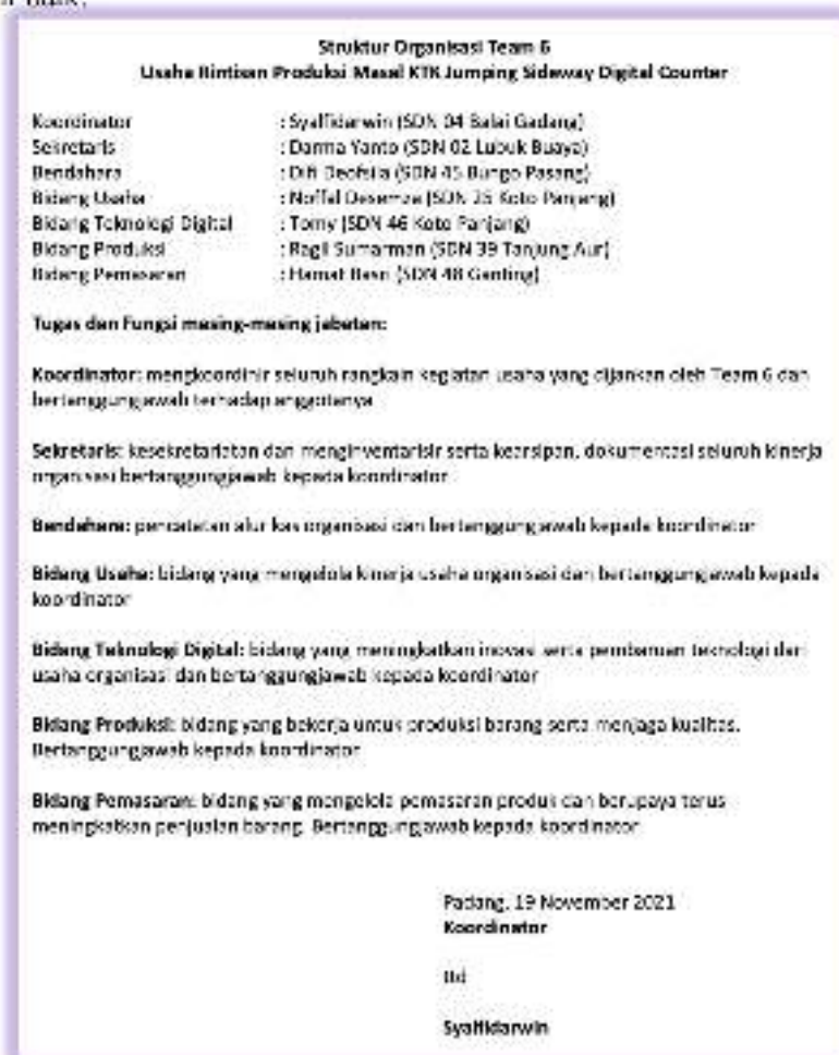
Gambar 8 Pembentukan pengurus organisasi Tim 6

Untuk saat ini, sumber daya manusia yang menjadi pioner sebanyak 7 orang di sekolah tersebut. Nantinya mereka akan memiliki job desk masing-masing, sehingga manajemen usaha dapat berjalan dengan baik.