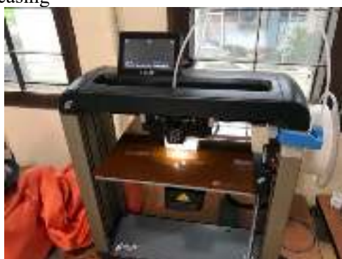
Gambar 3; Print 3d alat