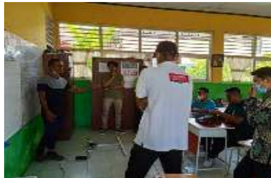
Gambar 6 Focus Group Discussion dengan para guru Wil II, KKG Kec. Koto Tengah

Sistem pengelolaan nantinya akan diatur oleh para guru di Tim 6 tersebut, dengan tetap dilakukan pendampingan hingga mereka dapat menjalankan usaha mereka secara mandiri.