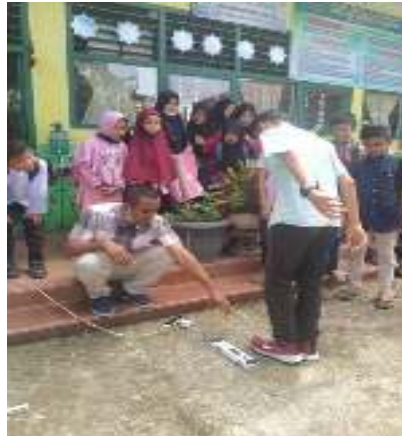
Gambar 5; Percobaan dengan siswa di SD 25 Koto Tengah

Produk akan diproduksi oleh guru di sekolah, kemudian akan digunakan oleh kalangan sendiri serta teman sejawat yang berada di Kota Padang. Bahkan yang juga akan jadi target konsumen adalah klub olahraga yang ada di sekitar sekolah seperti klub SSB Sepakbola, Bolabasket dan lainnya.