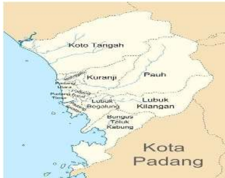
Gambar 2, Peta Lokasi