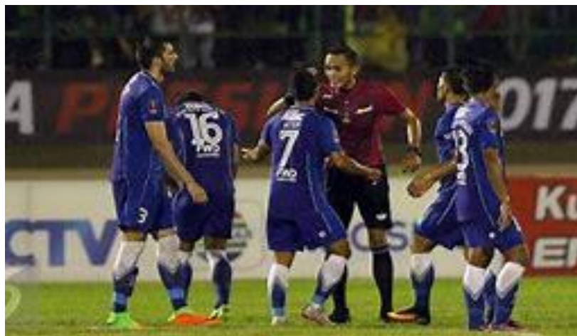
Gambar 1. Salah Satu ekspresi Wasit Pada saat adu argumen dengan pemain

Berangkat dari analisis situasi tersebut, maka kami dari tim menjadi terpanggil untuk memberikan pengetahuan-pengetahuan terbaru terkait pelaksanaan penanganan gangguan psikologis pada saat memimpin pertandingan. Sehingga diharapkan mampu meningkatkan pemahaman wasit dalam hal penanganan gangguan psikologi. Tim yang tergabung dalam kegiatan ini adalah dosen yang memang terlibat langsung dalam pembinaan di dalam masyarakat. (Asnaldi, 2019) Terkait dengan hal tersebut maka unsur kemampuan gerak (motor ability) dan konsentrasi secara praktis sebuah tuntutan utama dalam penguasaan KATA suatu teknik dikaitkan dengan kesempurnaan gerakan yang ditampilkan dalam menampilkan kata heian yodan di dukung dengan kondisi fisik yang baik pula.